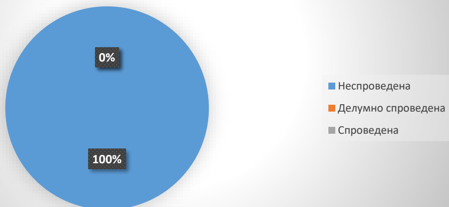
Графикон 4. Имплементираност на препораките во Законот за градење