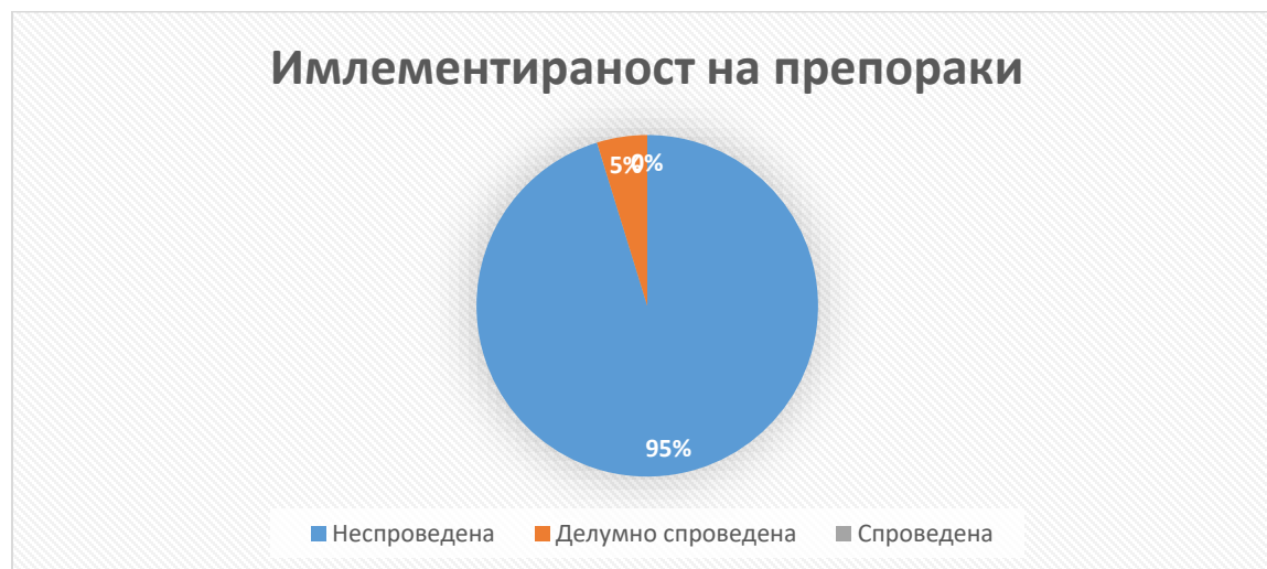
Графикон 1. Имплементираност на препораките

Она што би сакале да го потенцираме во однос на анализа за процентуалното исполнување на препораките е дека процентуалниот износ искажува многу ниско ниво во исполнување на препораките од овој прв квартален мониторинг , сепак мора да се напомене дека постои зголемена активност на локалната и извршната власт со цел да се имплементираат препораките. Исто така треба да се земе предвид дека постои застој во имплементацијата по однос на промена и донесување на нови законски и подзаконски акти акти со оглед дека во изминатиот период бевме во фаза на Ковид 19 пандемија, поради што генерално процесот во сите институции оди забавено во доколку се направи споредба во функционирање на системот во нормални услови.